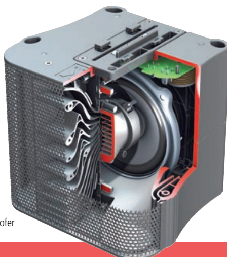
... der System-Subwoofer

kabel zu einem Stereosystem (mit zwei Subwoofern und vier Satelliten) koppeln lassen. Die dadurch erreichte Flexibilität dürfte eine Menge möglicher Anwendungen abdecken.